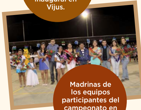
Madrinas de los equipos participantes del campeonato en inauguración en Santa María.