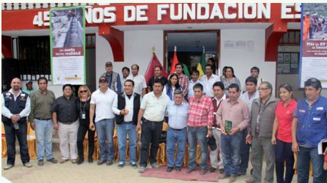
Ceremonia de entrega del canal de Chuquitambo - Carrizales al Gobierno Regional de La Libertad.

“Esta obra es un sueño hecho realidad. Es un canal que recorre 10.32 Km, desde el río Lavasén hasta una zona donde se podrá irrigar 202 hectáreas, en una segunda etapa mediante un sistema de riego tecnificado por aspersión. Hoy entregamos esta primera etapa 100% concluída”.