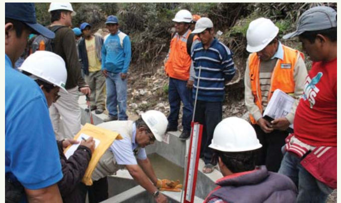
Inspección técnica a los componentes del canal de riego.

“Agradezco a los funcionarios de PODEROSA por acompañarnos, este es un gran ejemplo como la empresa privada también se involucra en los problemas de la comunidad”, dijo al referirse a esta obra.