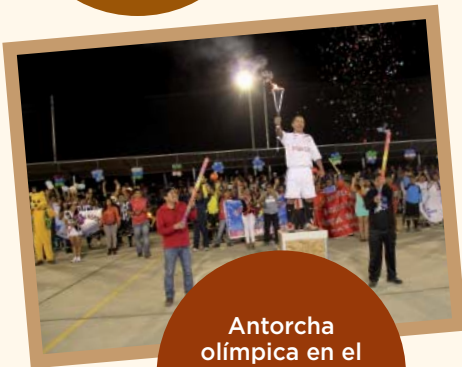
Antorcha olímpica en el inicio de los juegos en Santa María.