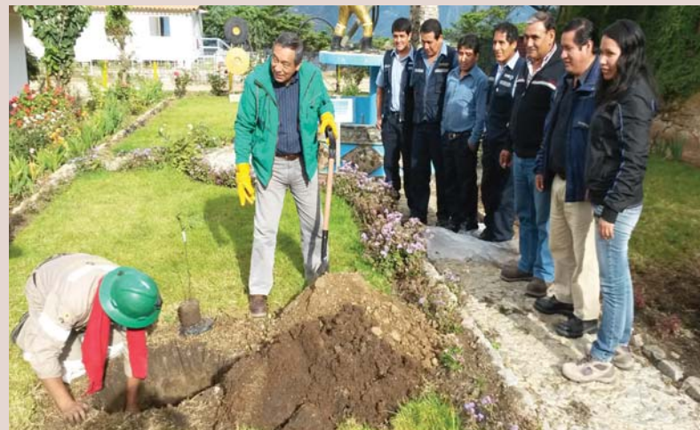
Seguridad participando en 35 Años, 35 Árboles.