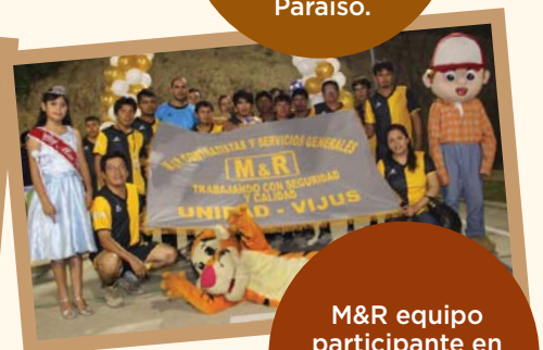
M&R equipo participante en el campeonato en Vijus.