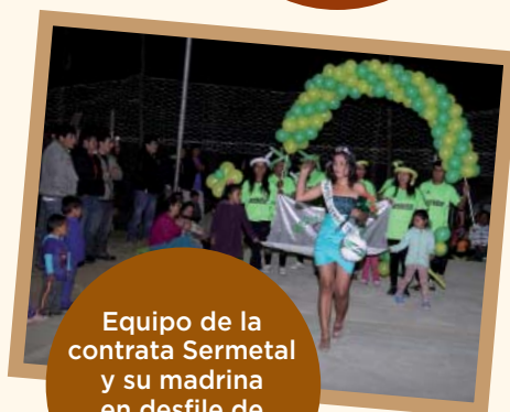
Equipo de la contrata Sermetal y su madrina en desfile de presentación en Cedro.