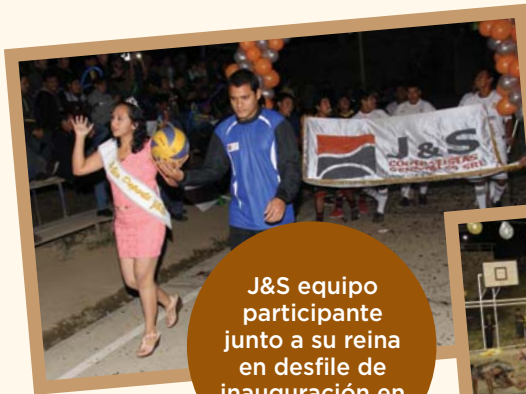
J&S equipo participante junto a su reina en desfile de inauguración en Paraíso.