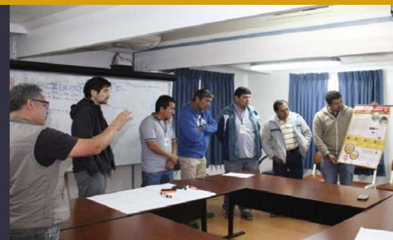
Paraíso, Mina y Planeamiento