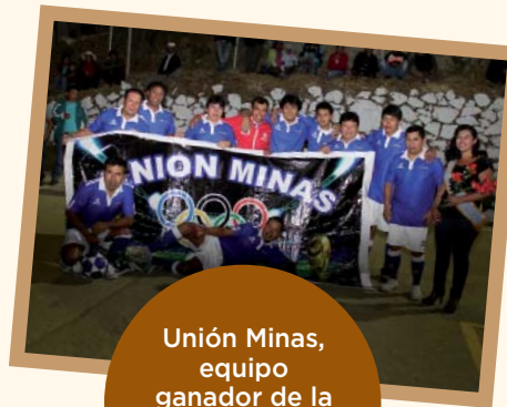
Unión Minas, equipo ganador de la presentación de equipos en Cedro.