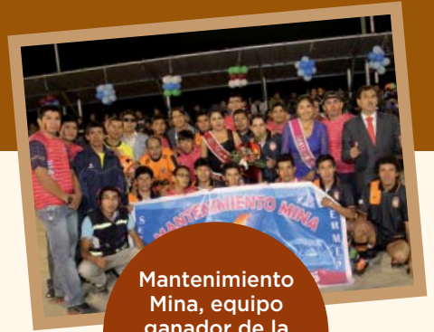
Mantenimiento Mina, equipo ganador de la presentación de equipos en Santa María.