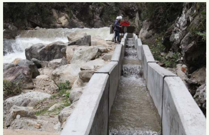
Canal de cemento de 136 metros al inicio de la obra.