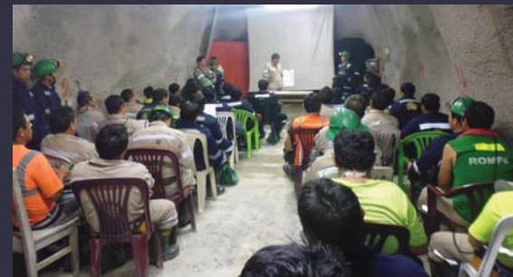
Santa María, Nv 1987