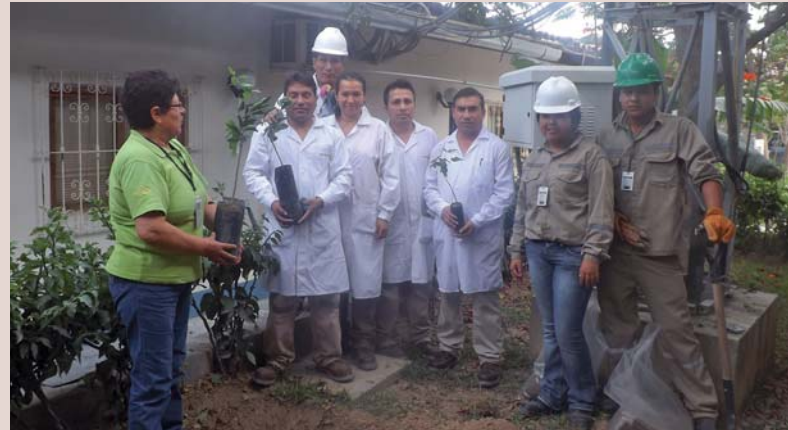
Laboratorio Químico sembrando sus plantas frutales.

En Santa María lo hicieron: Seguridad, Obras Civiles, Mina, Planta y Geología. En Paraíso: Mina, Geología, Planeamiento e Ingeniería. En Cedro: Seguridad y Medic Salud.