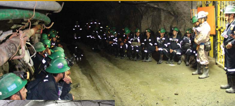
Mina Papagayo, contrata Tauro

PODEROSA agradece a los trabajadores de todas las áreas de las unidades mineras, contratas, y oficinas administrativas de Lima y Trujillo, por haber asumido el reto de cambiar de actitud y promover la ALERTA DE SEGURIDAD ; que tiene el objetivo de comunicar directamente: En PODEROSA la seguridad es tan importante como la producción.