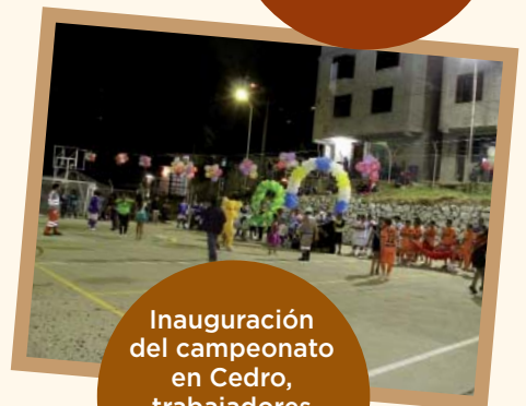
Inauguración del campeonato en Cedro, trabajadores y vecinos de la comunidad presentes.