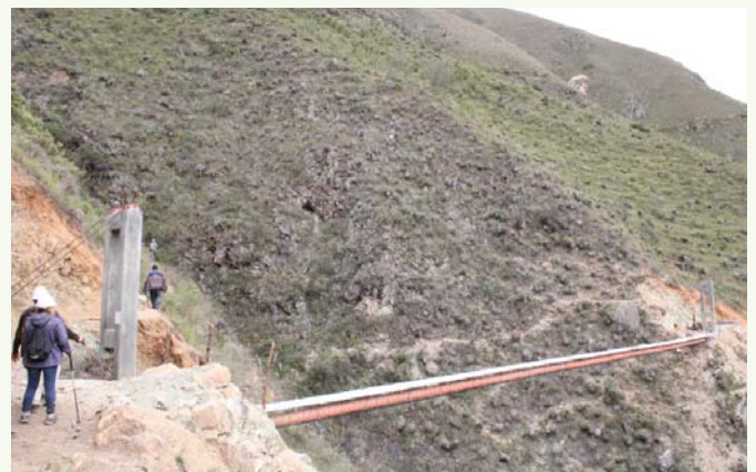
Pase aéreo de 50 metros.