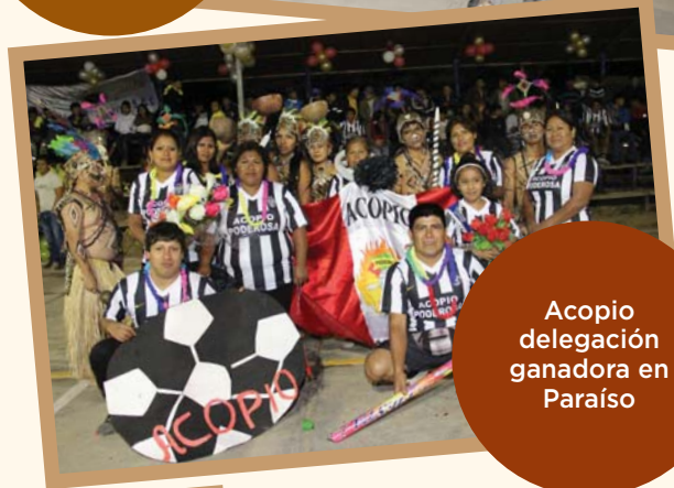
Acopio delegación ganadora en Paraíso