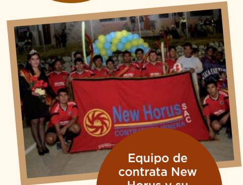
Equipo de contrata New Horus y su madrina en noche de inauguración en Cedro.