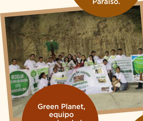
Green Planet, equipo ganador de la presentación de equipos en Vijus.