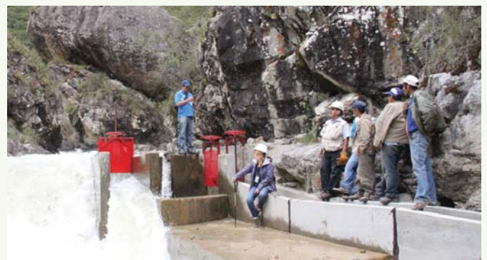
Bocatoma del canal de riego en el río Lavasén.