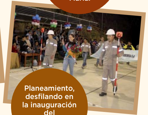
Planeamiento, desfilando en la inauguración del campeonato en Santa María.