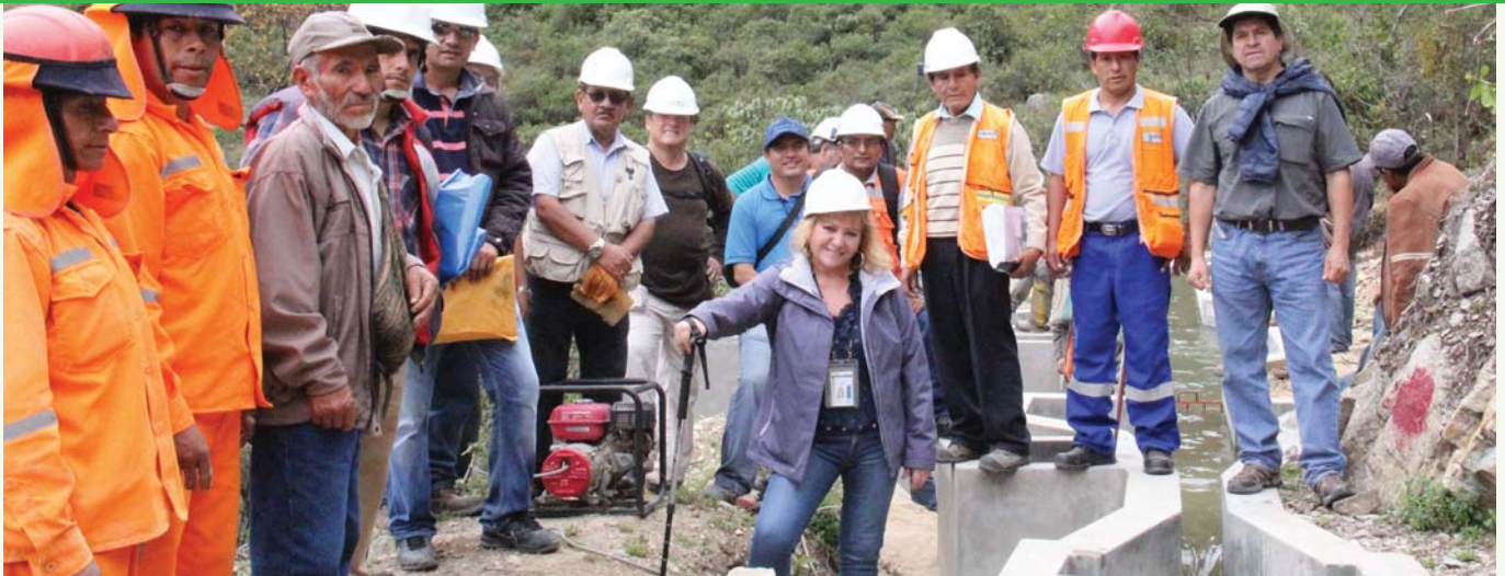
Equipo de trabajo de PODEROSA y GRLI en visita técnica al canal de riego.

La Comunidad Campesina Sol Naciente, anexo Chuquitambo, hace realidad un deseo añorado de sus pobladores, poder llevar agua del río Lavasén para regar sus tierras de cultivo; esto fue posible gracias al esfuerzo conjunto entre PODEROSA y el Gobierno Regional de La Libertad (GRLI).