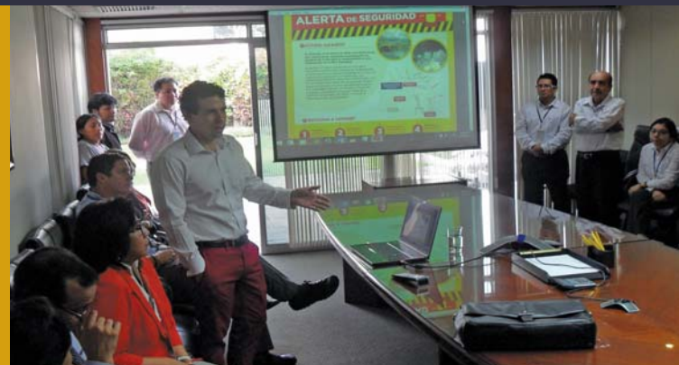
Lima, oficinas administrativas