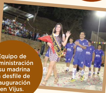
Equipo de Administración y su madrina en desfile de inauguración en Vijus.