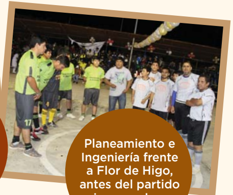
Planeamiento e Ingeniería frente a Flor de Higo, antes del partido inaugural en Paraíso.