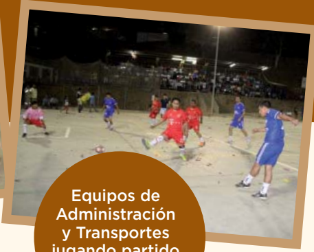
Equipos de Administración y Transportes jugando partido inaugural en Vijus.