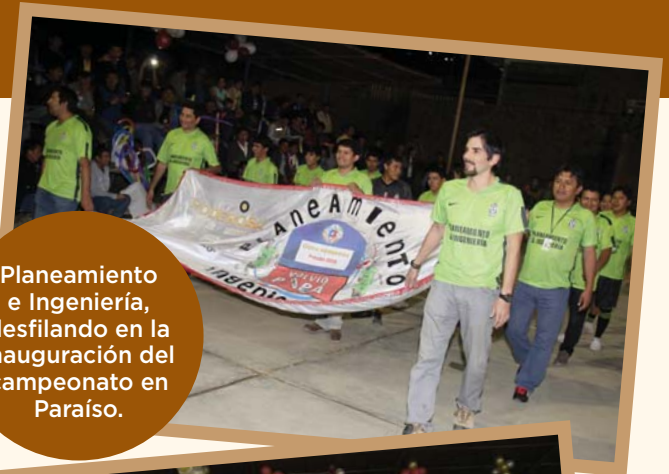
Planeamiento e Ingeniería, desfilando en la inauguración del campeonato en Paraíso.

El campeonato reúne a equipos de las distintas áreas de PODEROSA y de las contratadas. Este año los equipos ganadores de la mejor presentación fueron: Acopio (Paraíso), Green Planet (Vijus), Mantenimiento Mina (Santa María), y Unión Minas (Cedro).