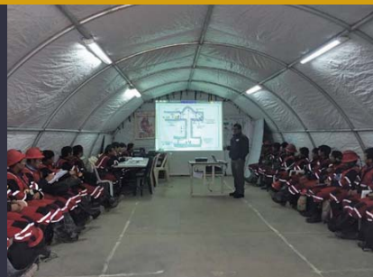
Cedro, contrata New Horus