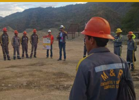
Vijus, contrata M&R