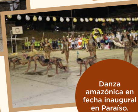
Danza amazónica en fecha inaugural en Paraíso.