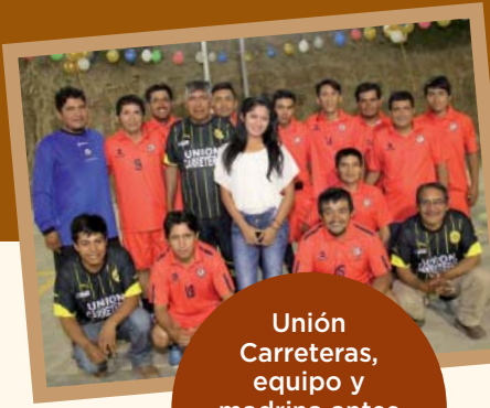
Unión Carreteras, equipo y madrina antes de desfilan en la inauguración en Vijus.