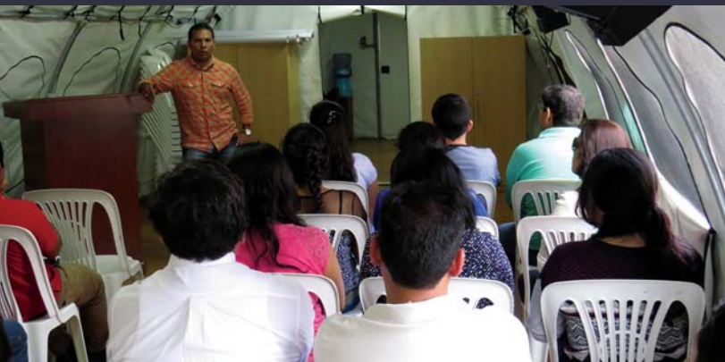
Trujillo, oficinas administrativas