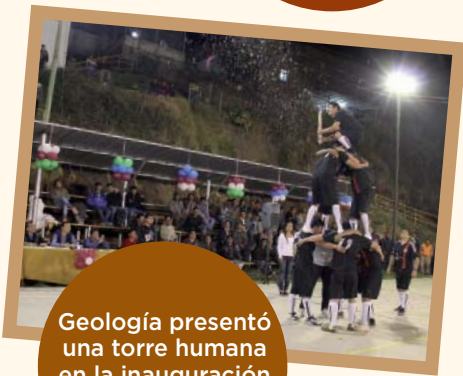
Geología presentó una torre humana en la inauguración del campeonato en Santa María.