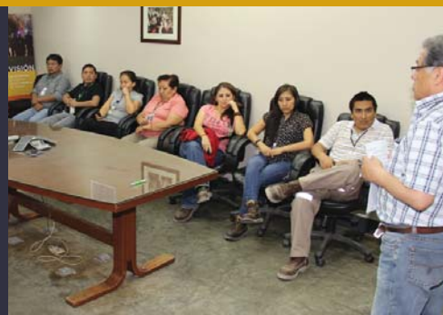
Vijus, SIG y Administración