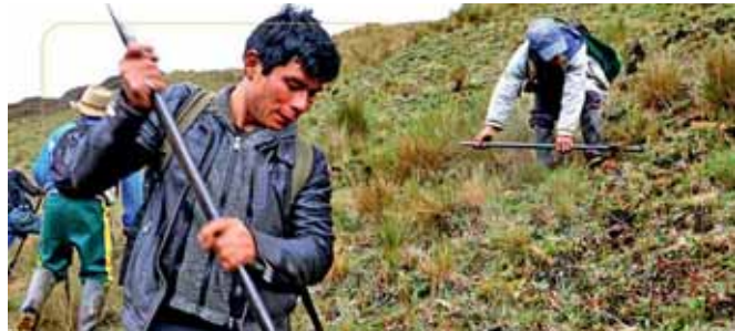
Esfuerzo conjunto con pobladores de la C.C. La Victoria.

La república se realiza alrededor de la laguna Huascacocha, con la participación de los pobladores de la comunidad campesina de La Victoria, a través de brigadas por cada anexo.