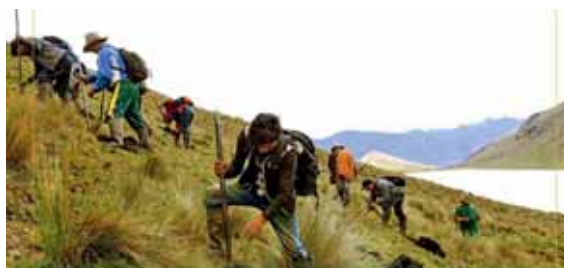
Habilitando la siembra.

EL DATO: Este proyecto tiene como meta forestar 1000 hectáreas.