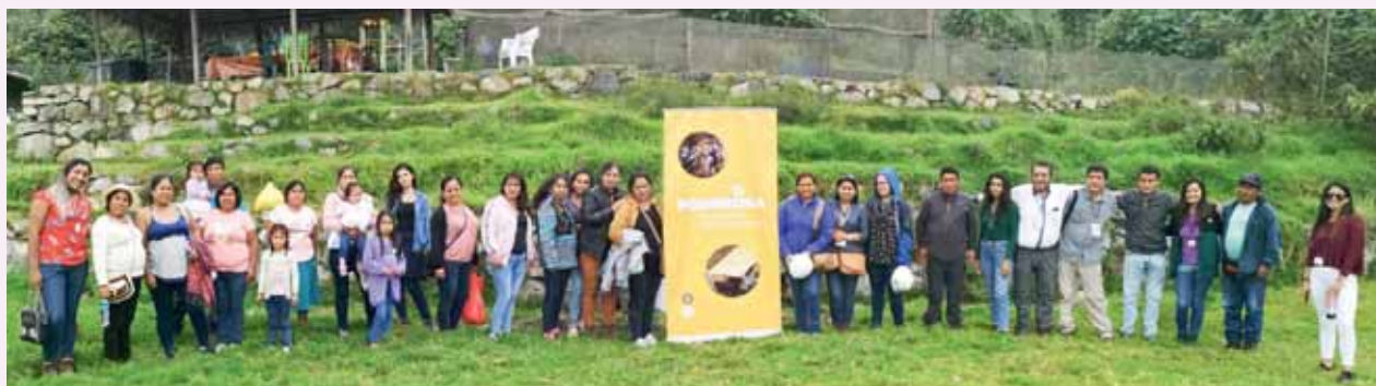
Equipo de Comunicaciones y 10 estudiantes de la UPC se reunieron con los 14 distribuidores del Batolito Comunitario para compartir experiencias.