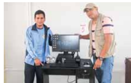
Escuela 80513 Santa Rosa de Los Alisos recibe equipos de cómputo.

El proyecto busca mejorar la calidad educativa de las escuelas del distrito de Pataz.