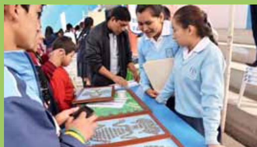
Presentación de proyectos productivos.