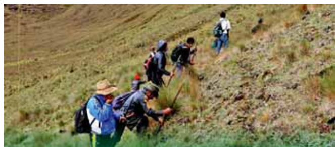
Forestación con plantones de pino.

EL DATO: Este proyecto tiene como meta forestar 1000 hectáreas.