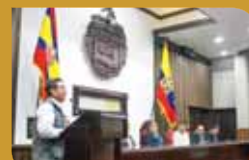
Municipios de Pataz firman convenio internacional