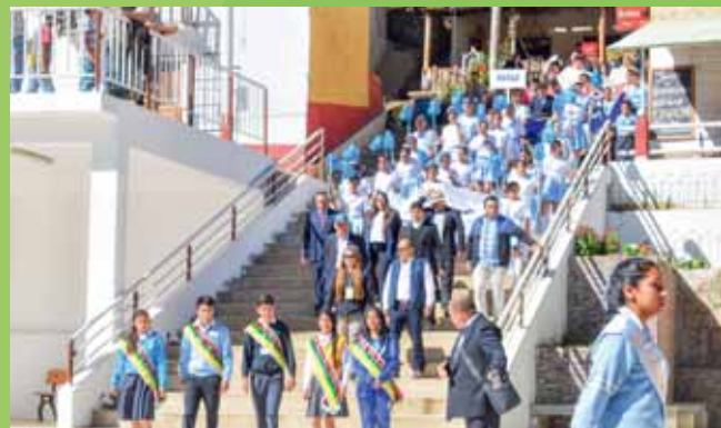
Pasacalle con la delegación de líderes escolares de la provincia de Pataz, autoridades locales, representantes de PODEROSA y Asociación Pataz.