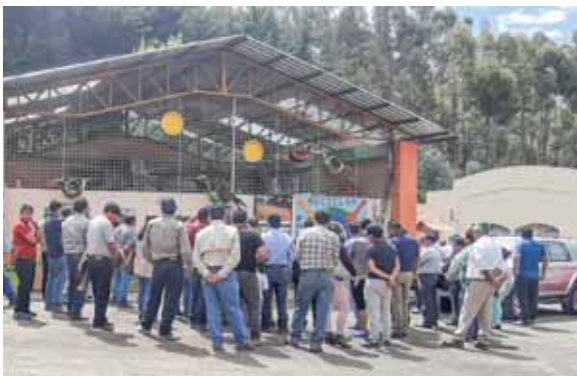
Centro de Gestión Integral de Residuos Sólidos de Loja.