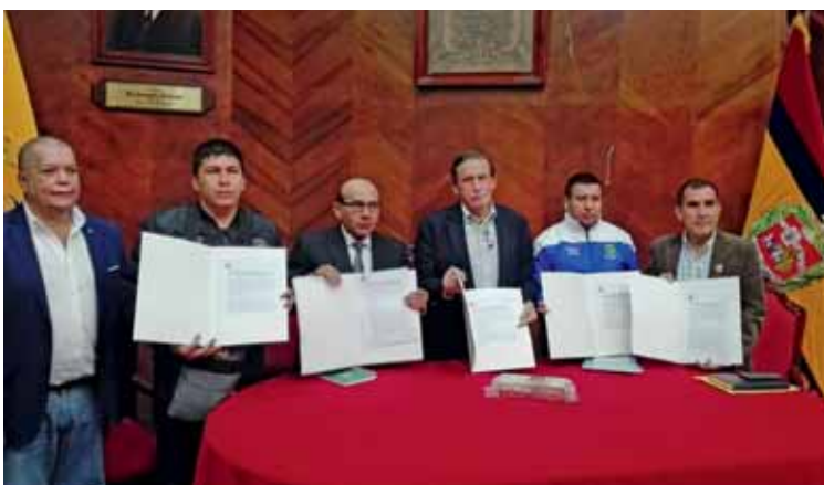
Alcalde de la provincia de Patate y alcaldes distritales de Patate, Parcoy y Huaylillas firmaron convenio.

“Me comprometo a trabajar con los alcaldes distritales de Patate, Parcoy y Huaylillas para que el intercambio de conocimientos se materialice en proyectos concretos que mejoren la calidad de vida de las familias patacinas. Gracias a Poderosa que nos está apoyando con la parte técnica para poder llegar y conocer esta ejemplar y gran ciudad”.