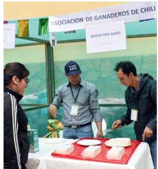
Productores agropecuarios muestran sus productos.

“Pataz se caracteriza por la minería, pero también sobresale en la producción agropecuaria aquí presente. Felicito a Asociación Pataz por su tercer año organizando la Feria. Agradezco a PODEROSA por el apoyo”.