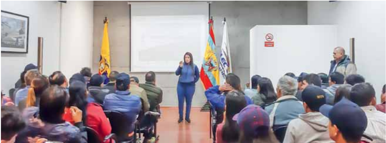
Visita a Central eólica Villonaco (A 2700 msnm, entre cantones Loja y Catamayo). Dispone de 11 aerogeneradores, cada uno genera 1.5 MW de energía eléctrica. Beneficia a 45 mil lojanos.