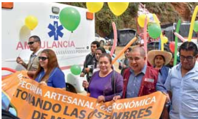
Pasacalle con las autoridades locales del distrito de Pataz y representantes de PODEROSA y Asociación Pataz.