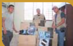
Renovación tecnológica de Telecentros

Afiche Nº 24: Coleccionales CUIDA EL AGUA PROTEJAMOS EL MEDIO AMBIENTE