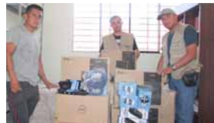
Nimpana. Equipos de computación se instalaron en escuela 80895.