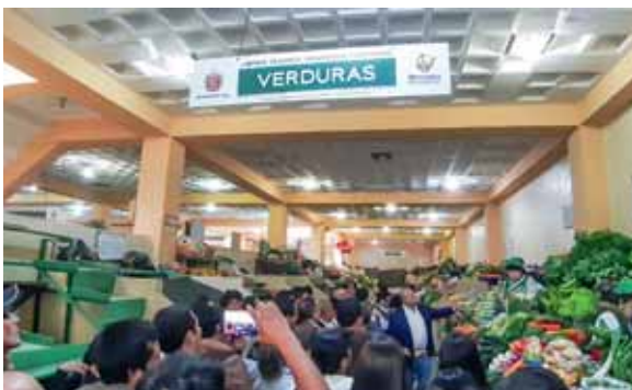
Mercado de Loja: limpio, ordenado y moderno sin perder la calidez.