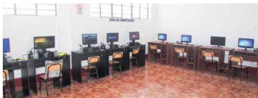
El proyecto usa la tecnología para mejorar la educación.