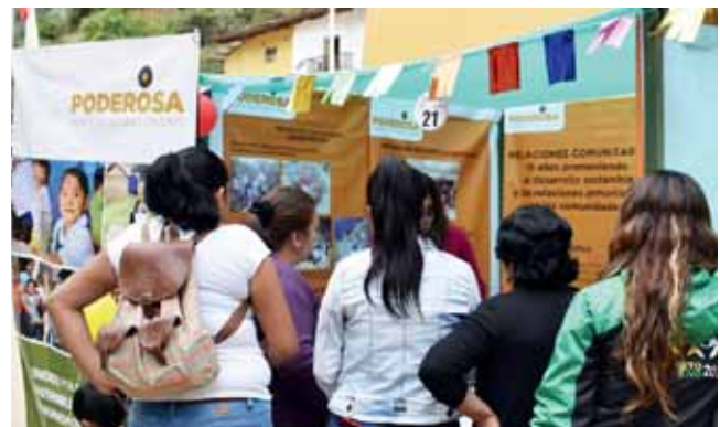
Pobladores informándose de las actividades que realiza el área de Relaciones Comunitarias.