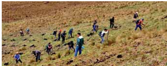
República de toda la comunidad.